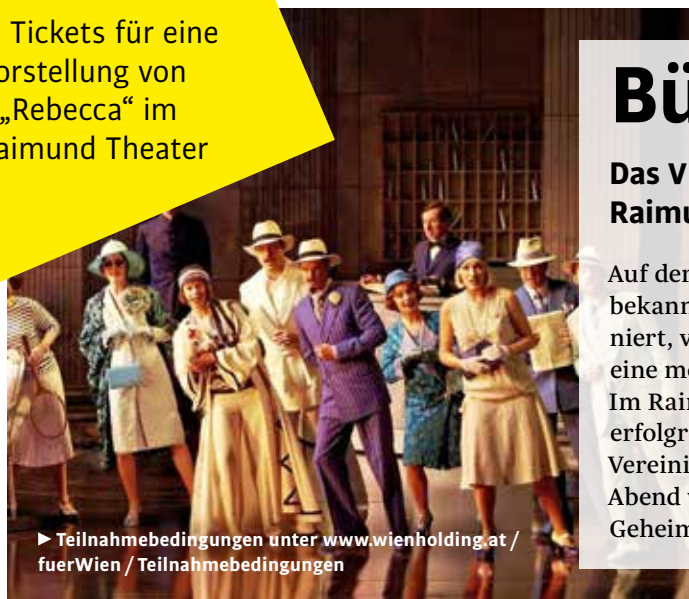
► Teilnahmebedingungen unter www.wienholding.at / fuerWien / Teilnahmebedingungen