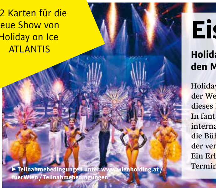
► Teilnahmebedingungen unter www.wienholding.at/fuerWien/Teilnahmebedingungen

Für Wien verlost 1 x 2 Karten für Holiday on Ice ATLANTIS in der Wiener Stadthalle am 17.1.2019, 19.30 Uhr. Senden Sie ein E-Mail an zeitung@wienholding.at (Betreff: „Atlantis“) Einsendeschluss ist der 10.1.2019.